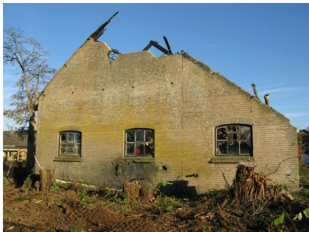
Pannenfabriekje van Knevel

In dit onderhoud werd gesproken over de historische panden, nieuw- en verbouwprojecten in het dorp en op de instellingsterreinen, voorstellen m.b.t. de straatnaamgeving en onderwerpen die aandacht verdienden.