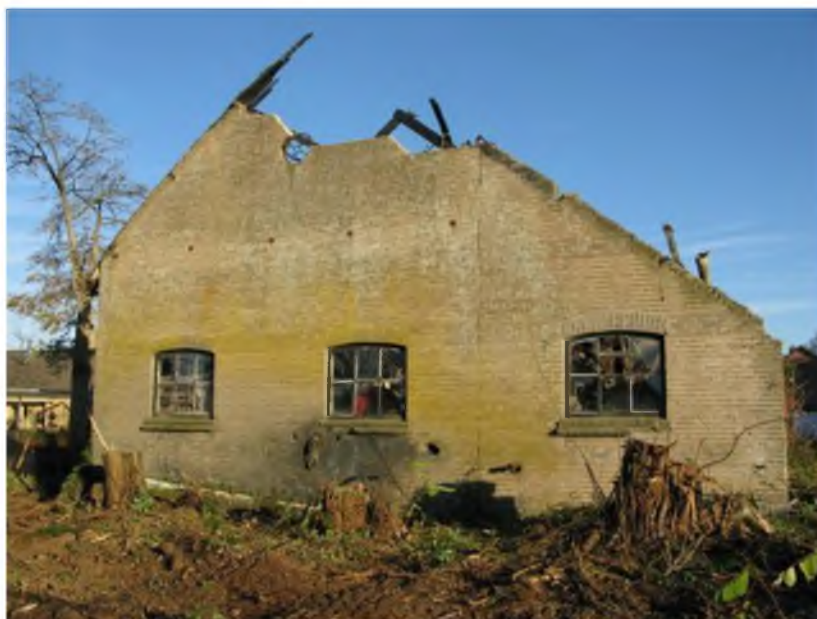
(Pannen)Fabriekje van Knevel en Oor

In dit onderhoud werd gesproken over de historische panden, nieuw- en verbouwprojecten in het dorp en op de instellingsterreinen, voorstellen m.b.t. de straatnaamgeving en onderwerpen die aandacht verdienen.